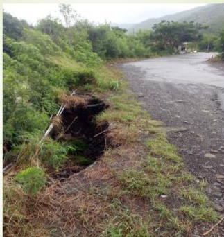
地點:下丹路外環道掏空。

月份、八月份颱風季節來的話一定會更加的嚴重，希望能夠跟縣府報告地點是在下丹路外環道旁邊的野溪，這個要趕快去處理。