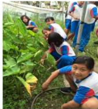
內獅國小 跟文化做朋友