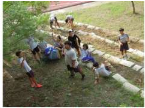
獅子國中-享受田園中的氣氛，攜手創造我們的開心農場！