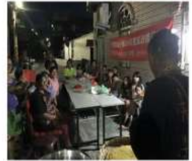
傳統文化要世代相傳