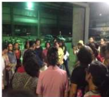
專注聆聽最動人的飲食文化