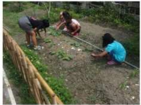
草埔國小-鋤草、施肥