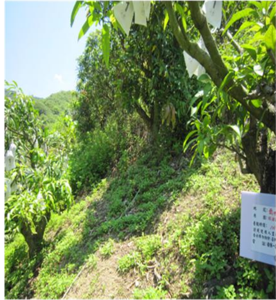
南世段：1682號 (租約自96/11/1-105/10/31) 現使用人：林促自 8720019 屏東縣枋山鄉加祿村6鄰會社路93號