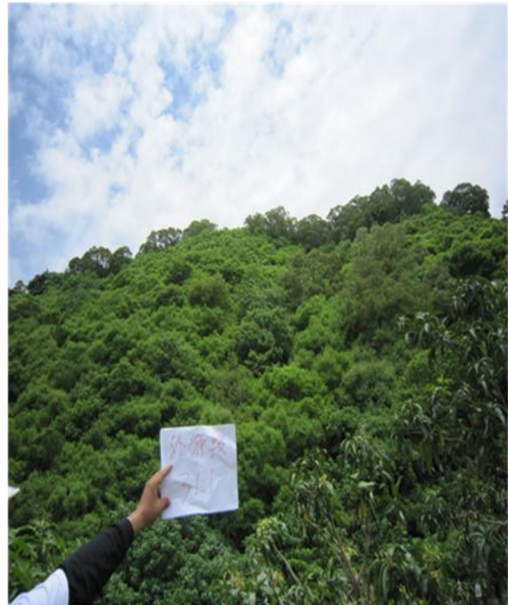
外獅段：311號 已無使用情形