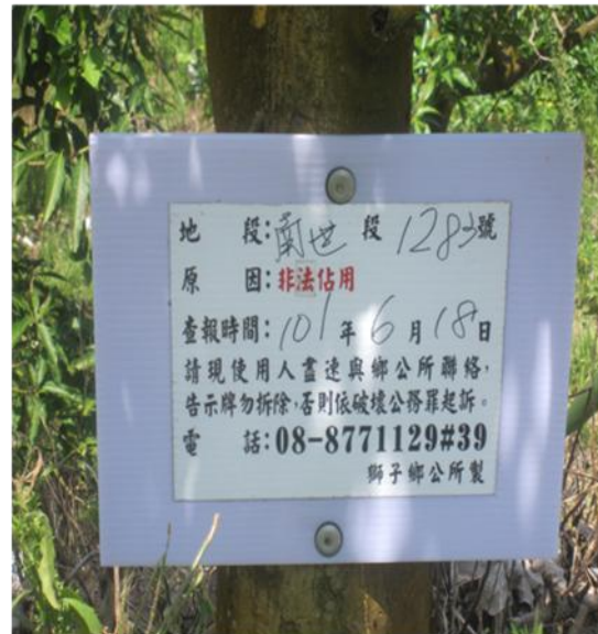
南世段:1283號 (佔用時間:達10年以上) 現使用人:未查出