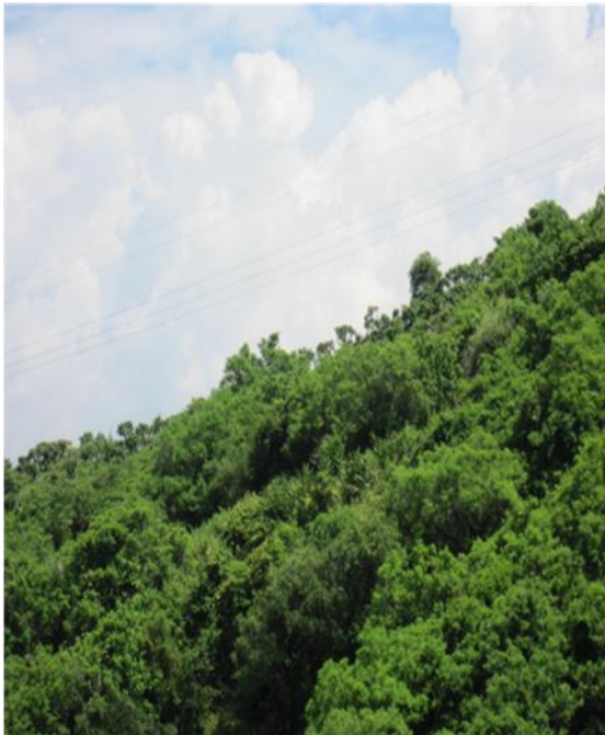
南世段：1514號 已無使用情形