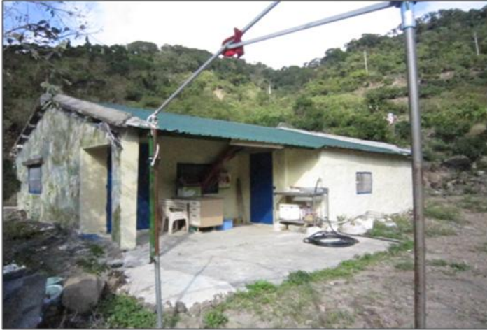
原住民保留地違規處理勘查照片 楓林段 ↑ 內獅段 →